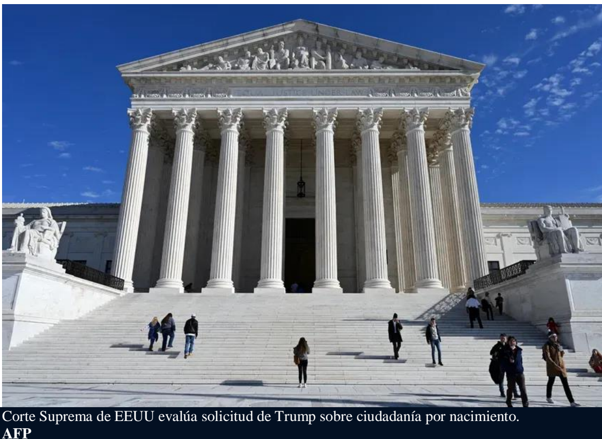
Corte Suprema de EEUU evalúa solicitud de Trump sobre ciudadanía por nacimiento.

Se trata de la segunda victoria judicial lograda por el presidente Donald J. Trump en materia migratoria en el mes de mayo. La Corte Suprema, en otra decisión previa, dio luz verde a la eliminación del Estatus de Protección Temporal (TPS) para los venezolanos. Información del Diario Las Américas de U.S.A que compartimos con ustedes.