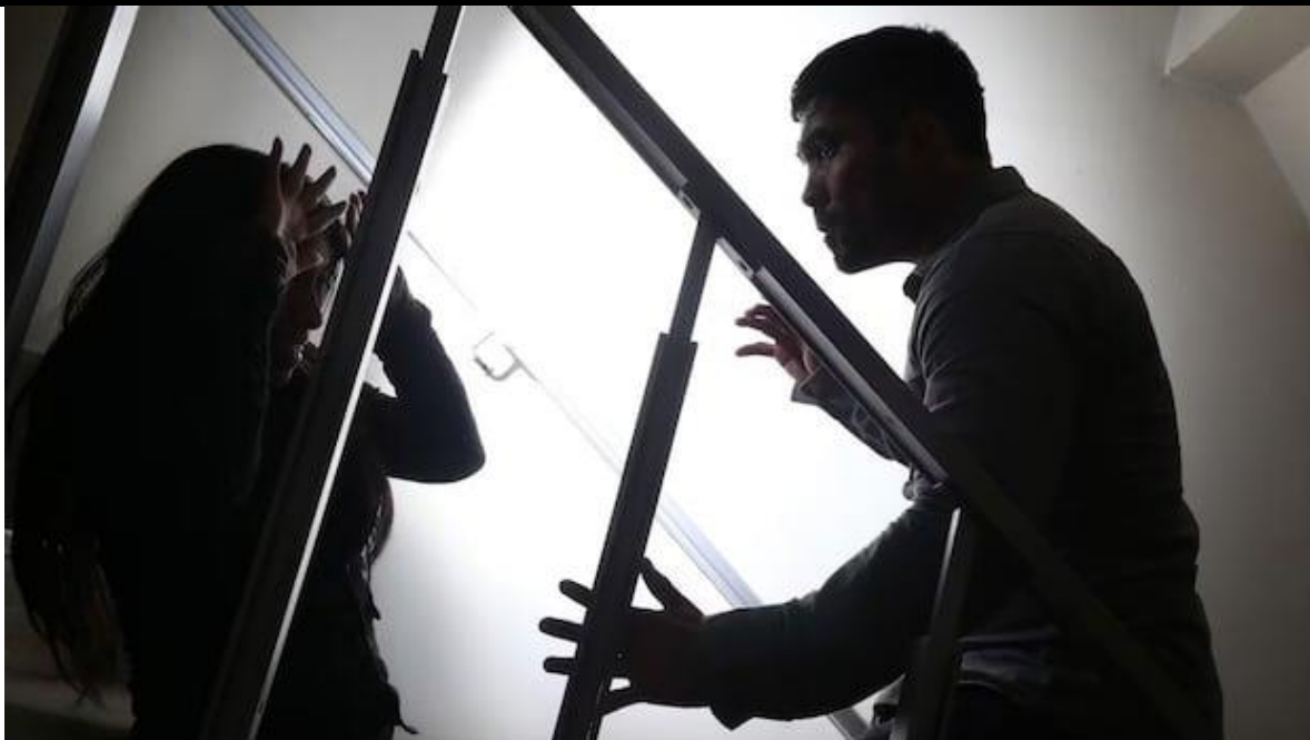
Medios de comunicación, sean privados o públicos, obligatoriamente deberán emitir contenido de concientización sobre la violencia contra la mujer.