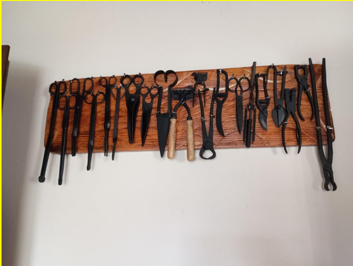
Foto de Daniel EL CAPADOR Tuve la suerte de encontrarme con un capador Que me hizo el favor de enseñarme

Se muestren a los niños y niñas a todos estos mal nacidos Echándoles en cara a todos estos deformes majaderos De la violación de los derechos humanos Del crimen, el asesinato y la muerte de pueblos enteros Su instrucción asesina y su talento Y queden a buen recaudo En la historia verídica del tiempo, tan curioso Porque así no puede ser el mundo que vivamos. No en nuestros días.