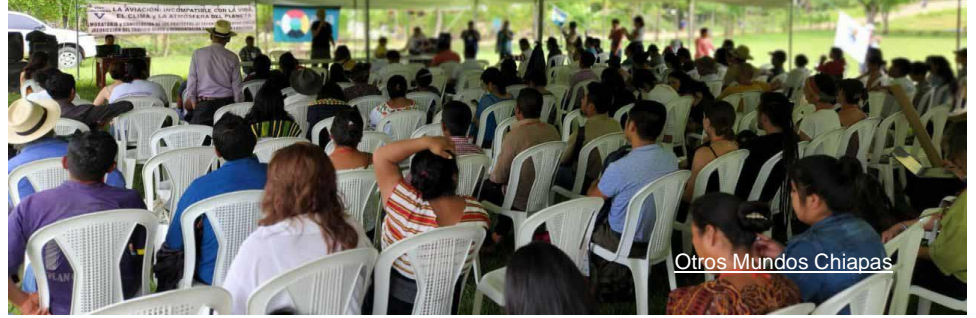
Otros Mundos Chiapas