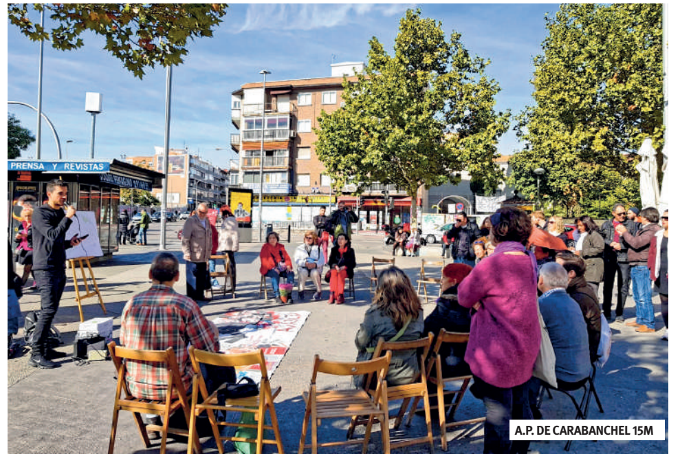
A.P. DE CARABANCHEL 15M

En algunas comunidades autónomas los Gobiernos regionales están intentado forzar que los grandes propietarios de la vivienda se introduzcan en el mercado, y que de lo contrario se puedan expropiar, tal y como avaló el Tribunal Constitucional.