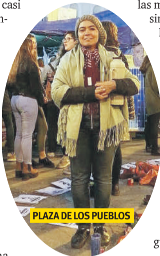
PLAZA DE LOS PUEBLOS

“[...]Tengo hígado, estómago, dos ovarios, / una matriz, corazón y cerebro, más accesorios. / Todo funciona en orden, por lo tanto, / río, grito, insulto, lloro y hago el amor. / Y después lo cuento”. ■