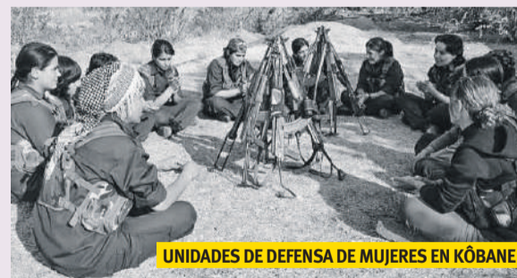
UNIDADES DE DEFENSA DE MUJERES EN KÔBANE

Extracto de artículo de l'altaveu del Poble Sec