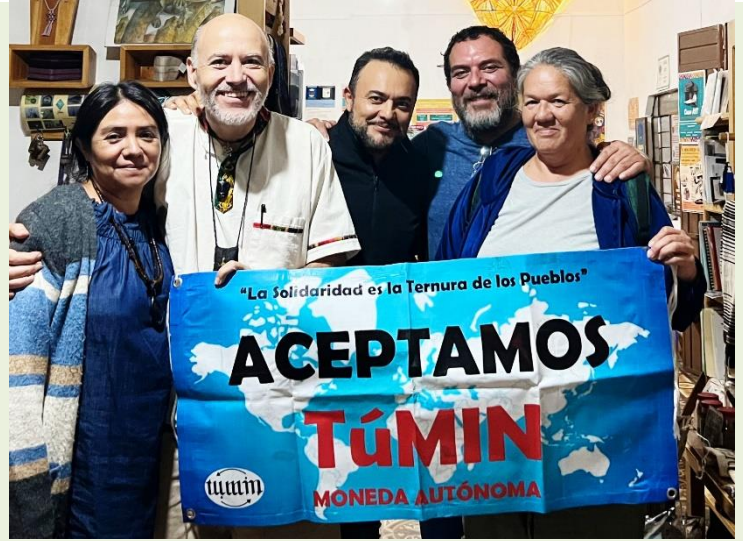
En Casa KIT, sede del Túmin-Oaxaca