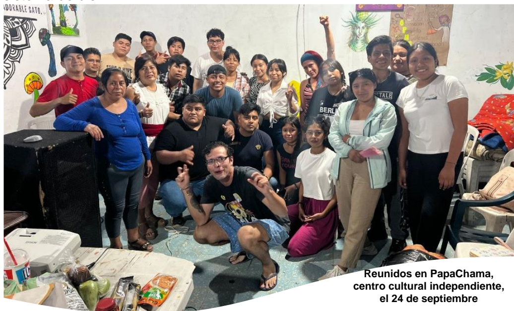
Reunidos en PapaChama, centro cultural independiente, el 24 de septiembre

Platicaron con la coordinación de Túmin-Totonacapan