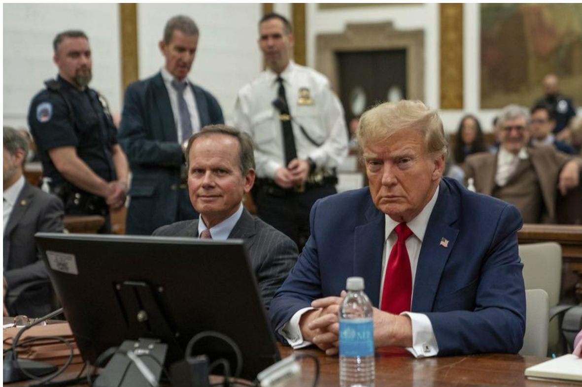
El presidente 45 de Estados Unidos, Donald Trump, participa como observador en el juicio civil en su contra en Nueva York.

El testigo clave de la defensa revisó todos los estados financieros de Trump y cuestionó el punto central de la demanda de la fiscalía en contra del expresidente, según artículo del Diario Las Américas de U.S.A. que compartimos con ustedes.